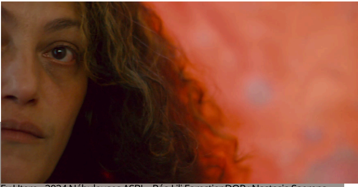
Ex Utero - 2024 Nébuleuses ASBL - Réa Lili Forestier DOP : Nastasja Saerens